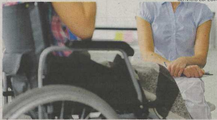
SERVICIO ESPECIAL Servicio de terapia sistémica a personas usuarias

Un equipo de profesionales de la psicología, especializados en el ámbito de la discapacidad, atienden a nivel individual, grupal y familiar tanto a personas residentes como a sus familias o personas cuidadoras. Esta terapia se ofrece de