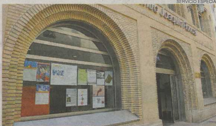
SERVICIO ESPECIAL El Centro Joaquín Roncal acogerá el acto del día 30.

El aforo estará limitado, por lo que hay que confirmar asistencia, antes del día 27, llamando al 976 738 581 o escribiendo a adrianaquintana@plenainclusionaragon.com . También se podrá seguir el encuentro en www.joaquinroncal.org .